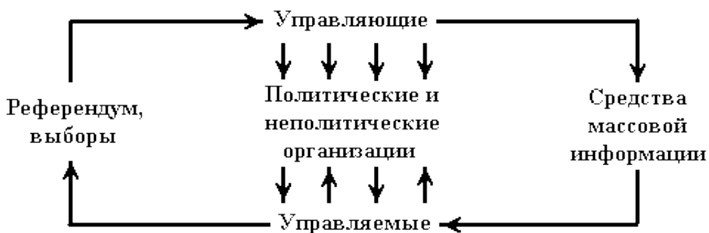
Рис.1. Модель политической коммуникации Ж.-М. Коттре.

Простым примером здесь может служить модель коммуникации французского исследователя Ж.-М. Коттре [6, с.125].